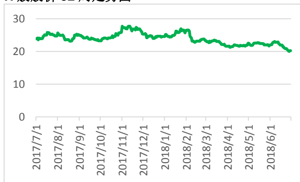
H 股股价 52 周走势图