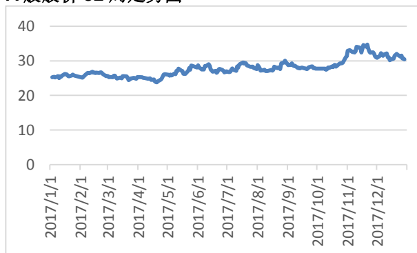
A 股股价 52 周走势图